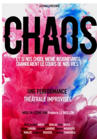
4 comédien.ne.s improvisateurs 1 metteur en scène "demiurge"