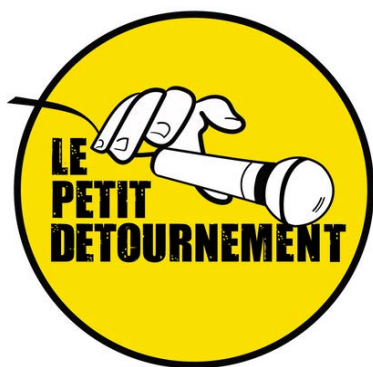
show de doublage improvisé