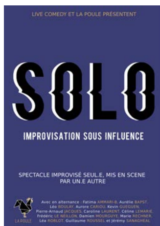
Solo sous l'influence d'un.e autre improvisateur.trice