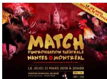
Match d'improvisation théâtrale

https://www.lapouleimpro.fr/ https://www.facebook.com/lapouleimpro/ lapoule.production@gmail.com