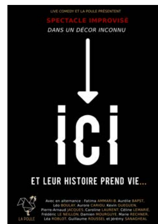
Longue forme dans un décor inconnu